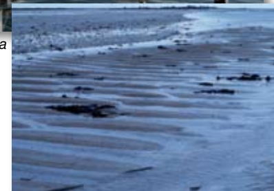
Strand i tidvattenområde