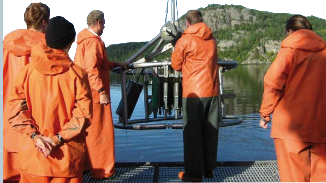
Studenter tar prover på havsbotten