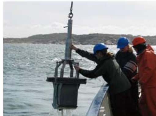
Maringeolog, en spännande framtid och en aktuell inriktning när det gäller våra hav och vårt klimat!